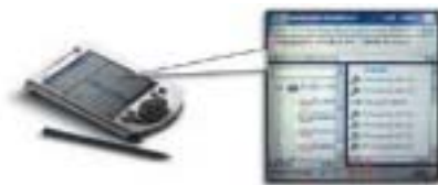
Captaris Workflow operating on Microsoft Pocket PC

Configuração de Workflow através de Assistente - Os Usuários de Informação podem configurar o workflow em qualquer lugar, de acordo com as regras de negócios, através de um Assistente passo-a-passo, assegurando a integridade da solução e criando uma interface amigável para os Usuários.