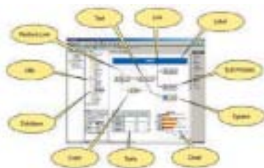
A Captaris Workflow Design Environment, with tools highlighted

Recursos de Workflow Ilimitados - Com o Captaris Workflow, Designers podem criar workflows para qualquer situação de negócios. O Captaris Workflow permite chamar workflows de dentro de workflows, monitorar eventos, pular tarefas e ter opções para quando se está fora do escritório.