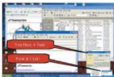
Client Workflow Services with Captaris Workflow

Desenvolvimento Rápido de Soluções – O Captaris Workflow proporciona um robusto Ambiente para Desenvolvimento Integrado (IDE) permitindo a criação de soluções de workflow de forma rápida e fácil. O IDE tem uma série de recursos poderosos, apresentados sob a forma de ferramentas para desenvolvimento padrão Microsoft: